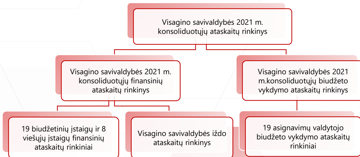
1 pav. Visagino savivaldybės konsoliduotųjų ataskaitų rinkinio sudėtis

Savivaldybės administracija įstatymų nustatyta tvarka organizuoja savivaldybės biudžeto pajamų ir išlaidų bei kitų piniginių išteklių buhalterinės apskaitos tvarkymą, rengia savivaldybės konsoliduotųjų ataskaitų rinkinį ir teikia Lietuvos Respublikos finansų ministerijai. Visagino savivaldybės konsoliduotųjų ataskaitų rinkinio sudėtis pateikta 1 pav.