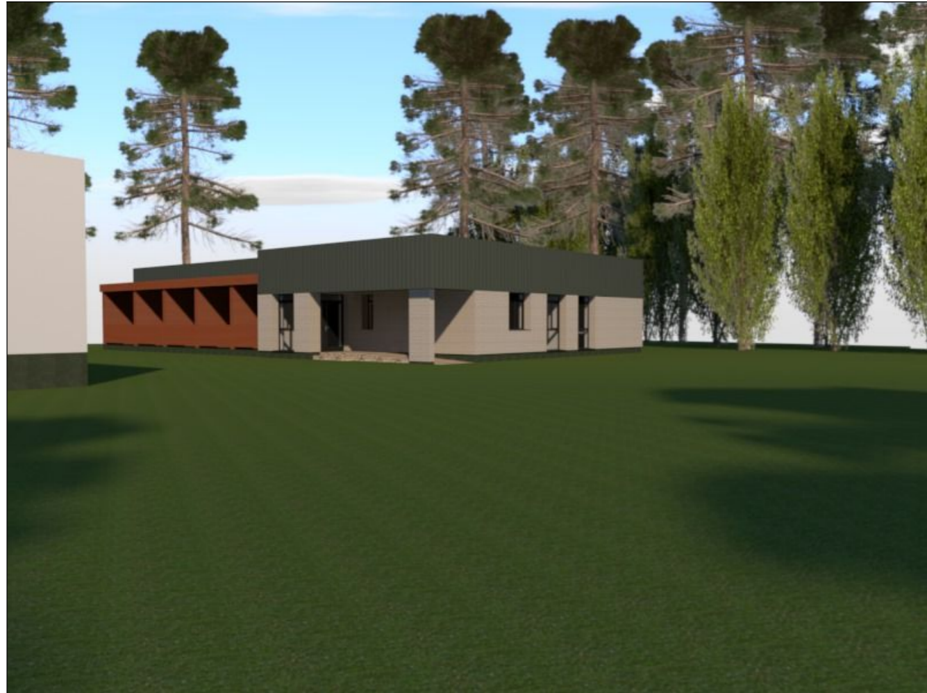
Vizualizacija Nr. 1