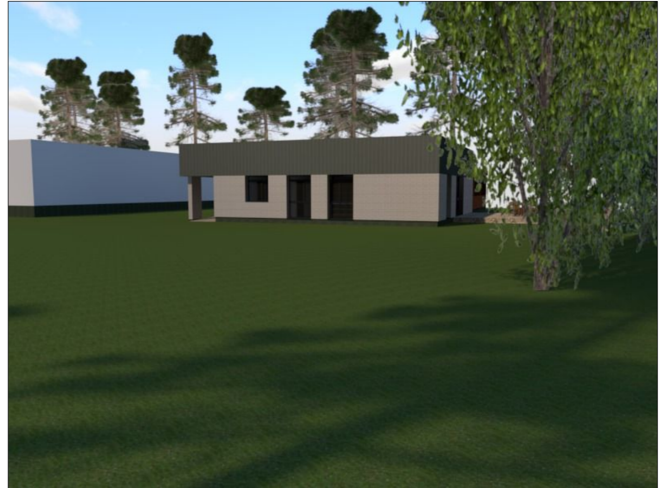
Vizualizacija Nr. 2