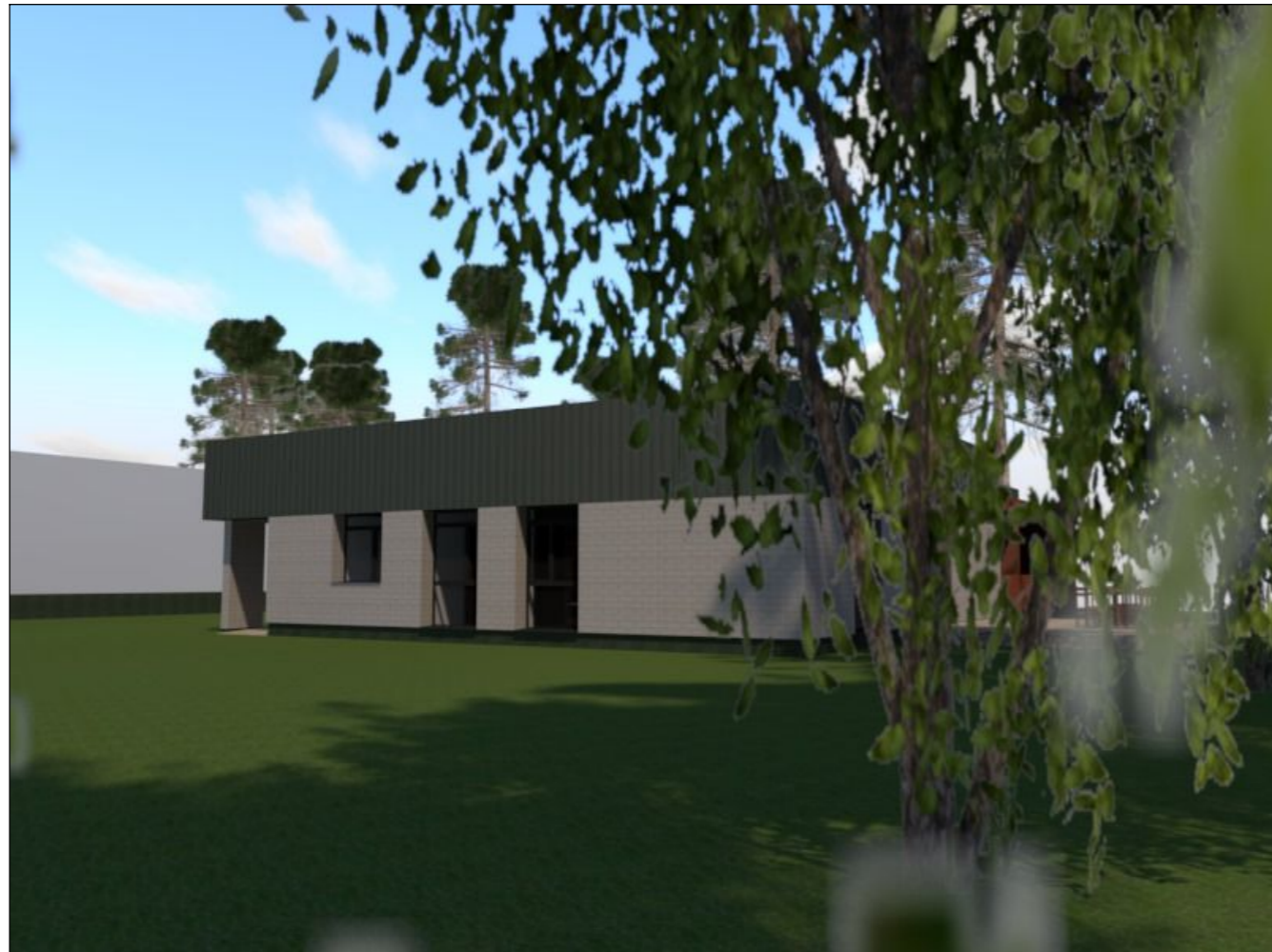
Vizualizacija Nr. 3