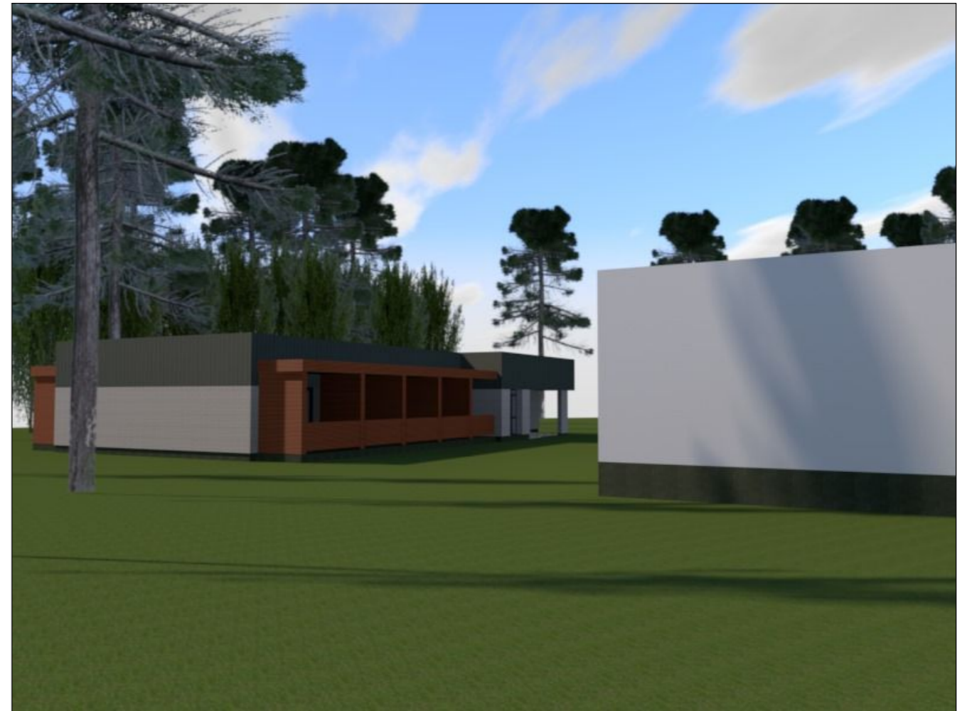
Vizualizacija Nr. 4