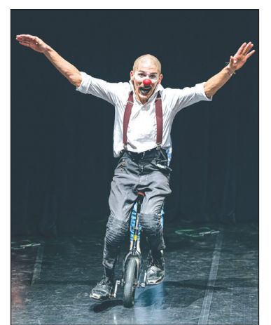
Visagino kultūros centro informacija Užsakymo Nr. 3971